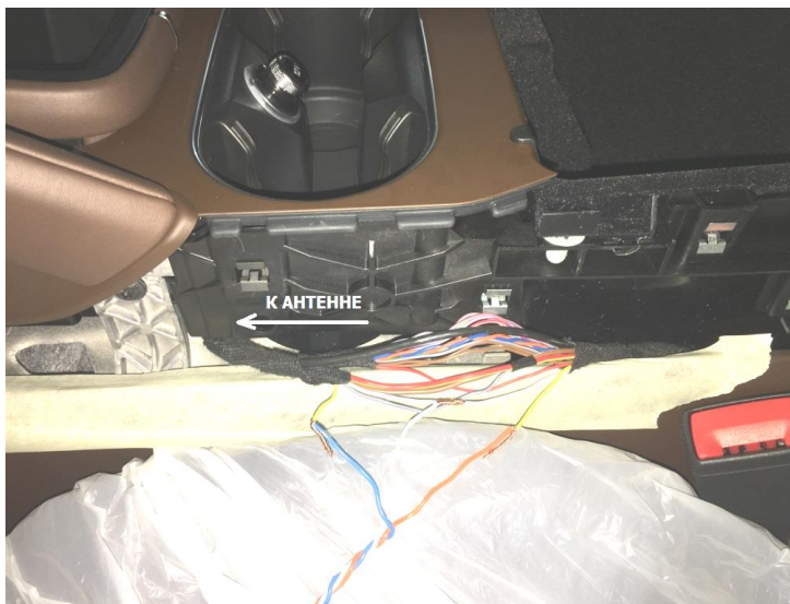
Фото. 1. Подключение к антенне в центральной консоли слева от подстаканников.