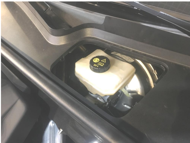
Фото 2. Место лючка для доступа к датчику тормоза.