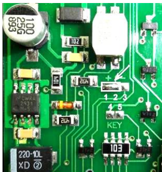
Фото 4. Перемычка 1-2