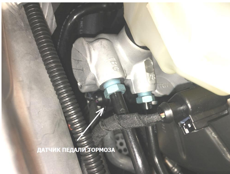
Фото 3. Расположение датчика педали тормоза.