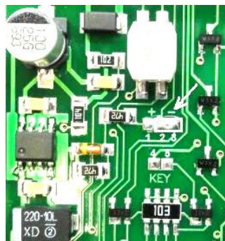
Фото 5. Перемычка 2-3