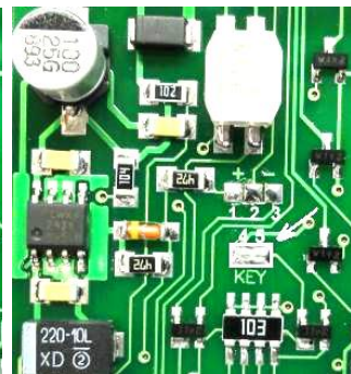
Фото 6. Перемычка 4-5